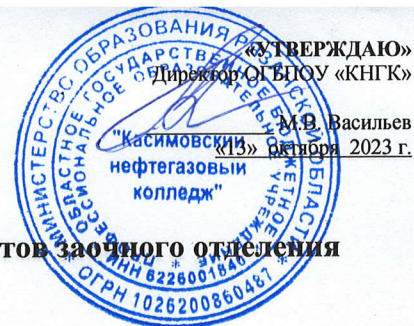
График проведения установочной сессии для студентов заочного отделения