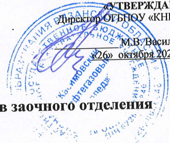
График проведения установочной сессии для студентов заочного отделения