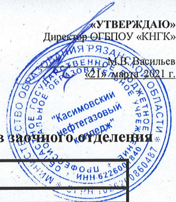
График проведения экзаменационной сессии для студентов заочного отделения