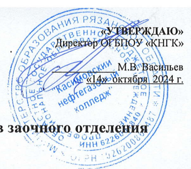
График проведения установочной сессии для студентов заочного отделения